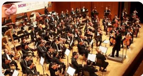
MOM兩地一心 【弦動心靈】 慈善音樂會 2009