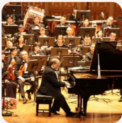
現代美容中心 【生命因你動聽】 慈善音樂會 2007