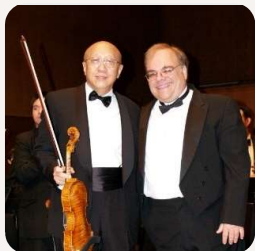
【心繫農村】 慈善音樂會 2005