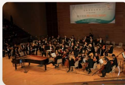
【聽你·聽我】弦動 慈善音樂會 2017