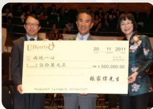
兩地一心 【弦亮生命】 慈善音樂會 2011