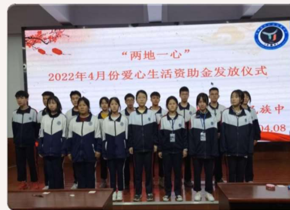
貴州台江民中頒發助學金儀式

2023 兩地一心慈善音樂會 U-Hearts Charity Concert 2023