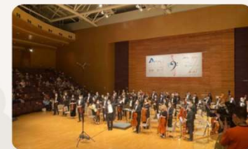
「安山金控」呈獻 兩地一心十五周年 【弦續·愛】 慈善音樂會 2021