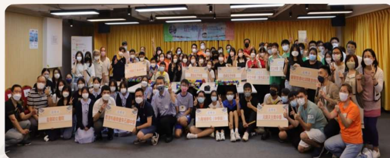
「造橋者」公民教育工作坊