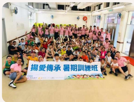
暑假小領袖訓練營