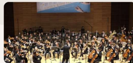
【聽你·聽我】弦續 慈善音樂會 2018