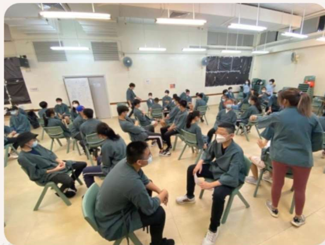
初心青少年袖訓練營