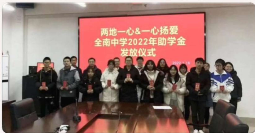
江西全南中學頒發助學金儀式

以 獎學金 形式，受惠對象會以初中為主， 鼓勵偏遠地區學童積極追求夢想 ，自強不息，與建校服務地區相連，增強協同效應。