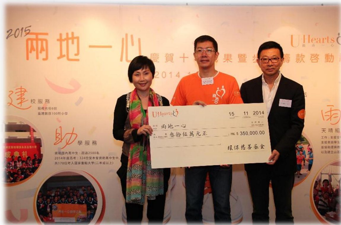
感謝環保慈善基金榮譽贊助