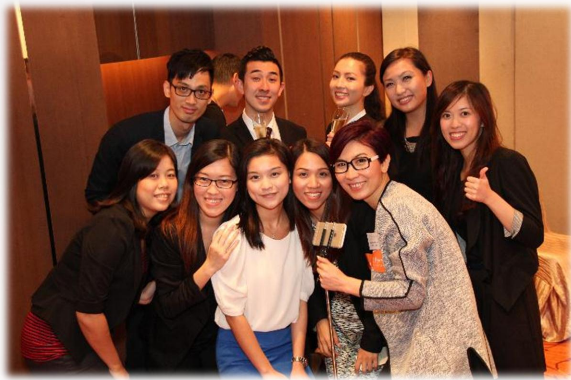
專業C2司儀義工團，增添活動氣氛