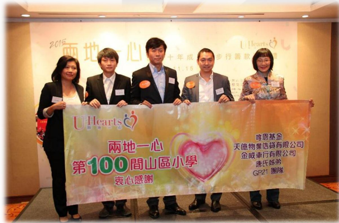
兩地一心已重建達 100 所小學